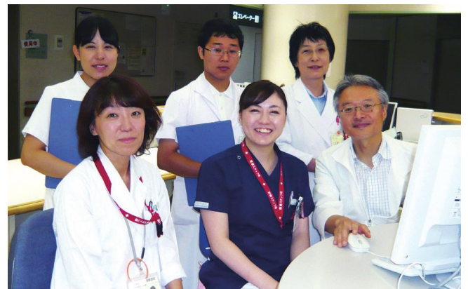
認知症疾患医療センタースタッフ