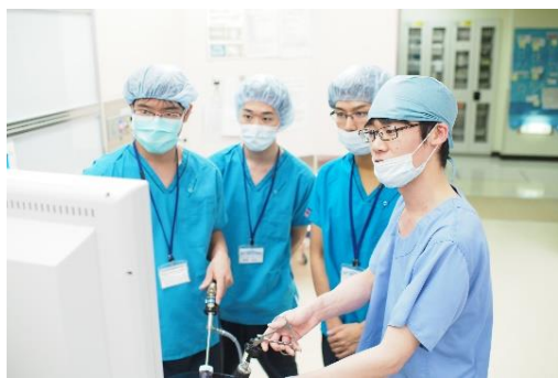
腹腔鏡下子宮筋腫摘出術鏡視下手術を体験！！