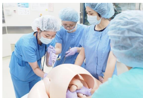
生命の神秘をこの手で経験！ シナリオ形式の鉗子分娩体験!!